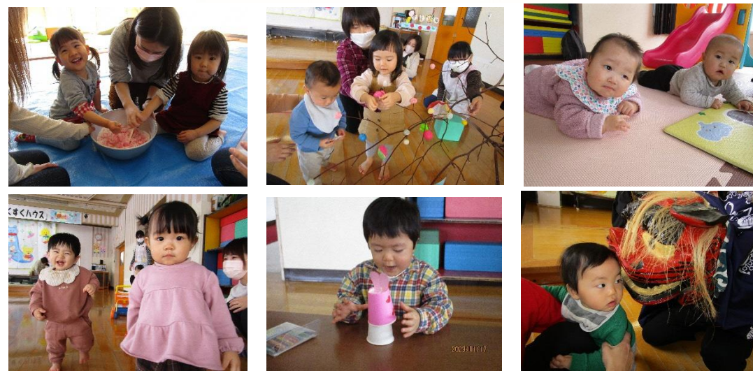
※すくすくハウスの様子は、町HPの「みさとぐらし」のブログよりご覧いただけます。また、町HPにも「すくすくだより」を掲載しています。