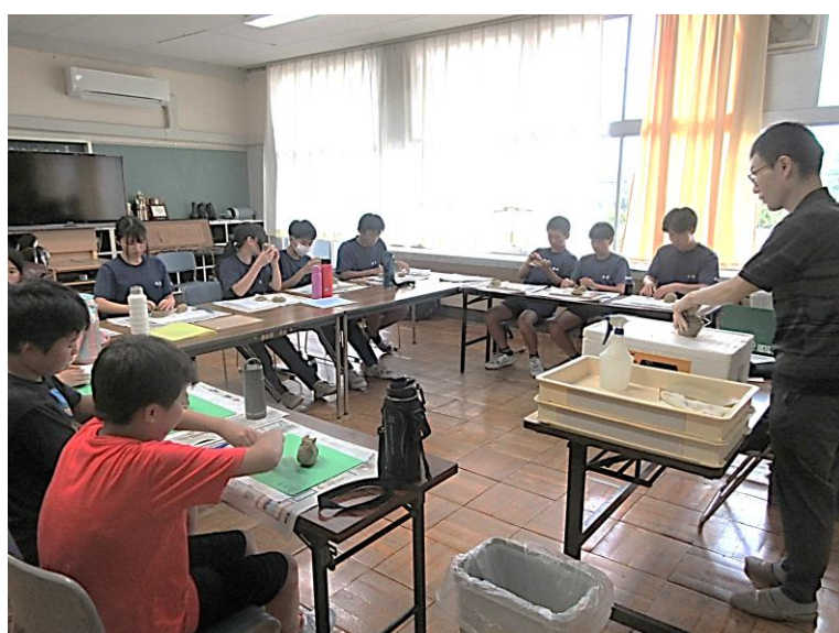
<本郷学園の地域の講師による焼き物の学習>