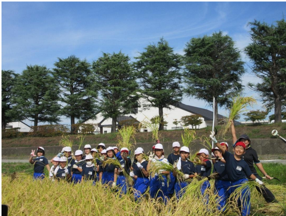
〈新鶴小学校の稲刈り〉