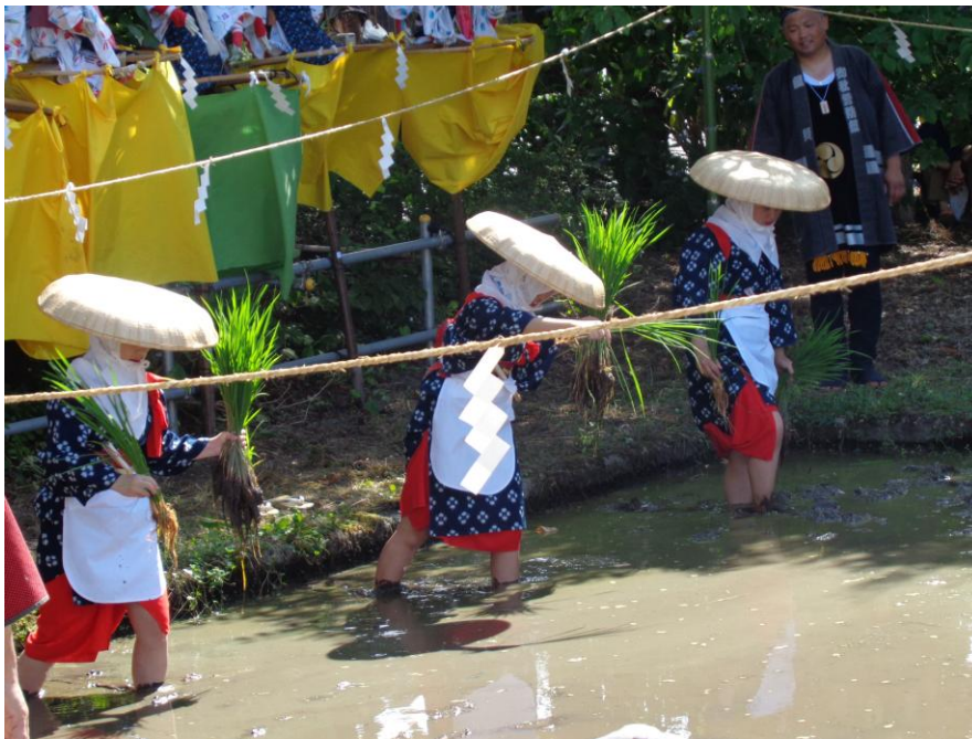
〈御田植祭への参加〉

地域の豊かな資源を活かし、伝統・文化等に関する教育を教育課程に明確に位置づけます。地域の職人や伝承者を学校に招いたり、児童生徒が直接史跡や文化財を訪れたりする体験学習を増やし、地域の歴史や文化を深く理解し、その価値や魅力に気づく機会を提供することにより子どもたちの郷土愛を育むとともに、将来の地域社会の担い手としての意識を高める基盤づくりを行います。