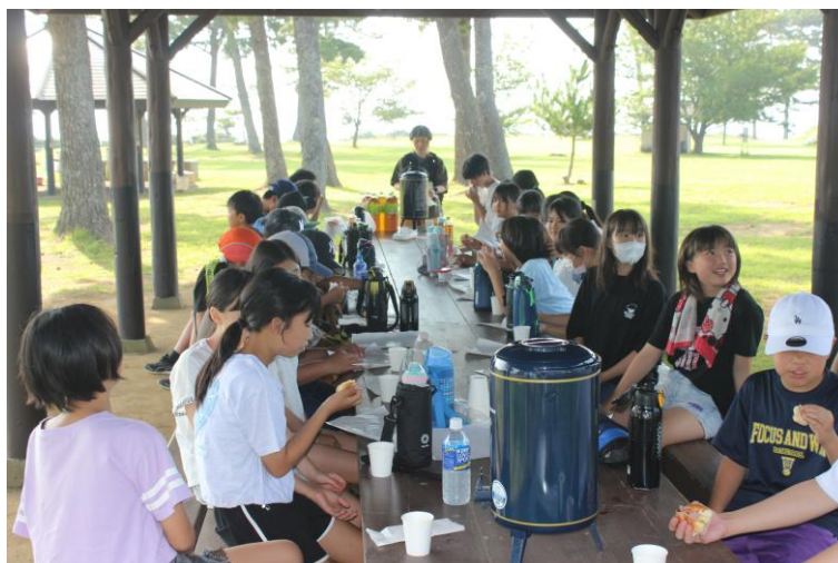
<会津美里町×檜葉町 絆伝承交流宿泊体験活動>