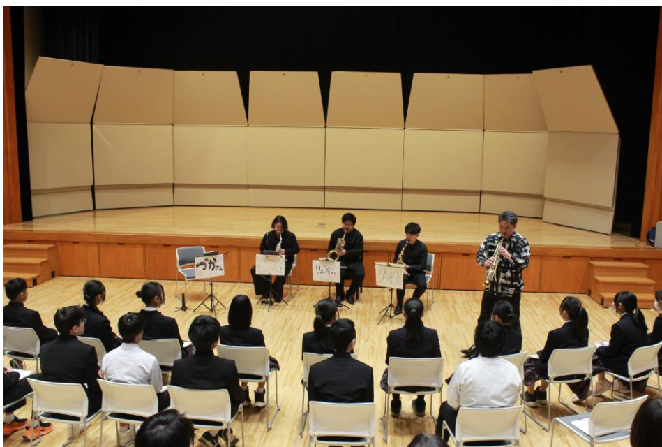
<公共ホール音楽活性化事業・アクティビティ>