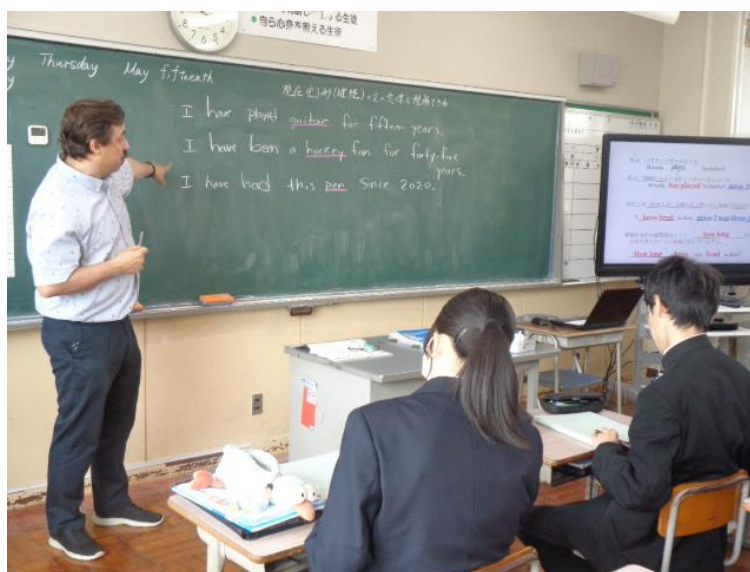
<ALTによるICTを活用した授業>