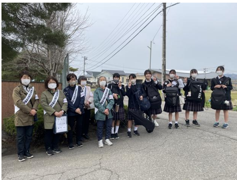
<新鶴中学校地域の方々とのあいさつ運動>