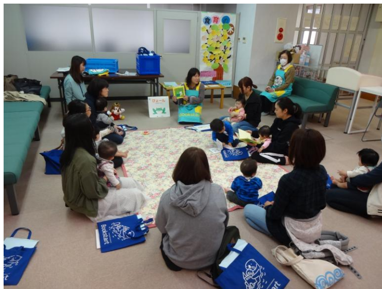
<ブックスタート事業>

家庭と地域、学校が連携し、子どもが安心して成長できるようメディアコントロールを推進し、テレビやインターネット端末、ゲーム機などの情報機器やSNS、生成AIなどの利用について、家庭でのルールづくりや適切な利用方法の啓発を行い、健全な成育環境の実現を目指します。