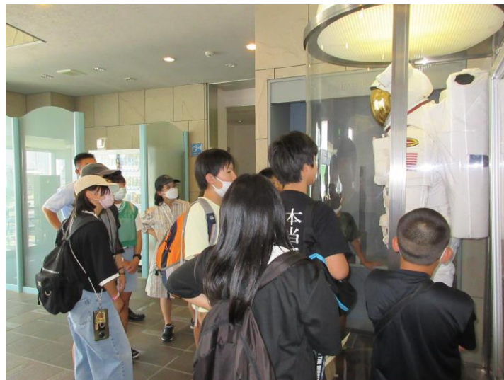
<いきいき体験事業・JAXA 筑波宇宙センター>