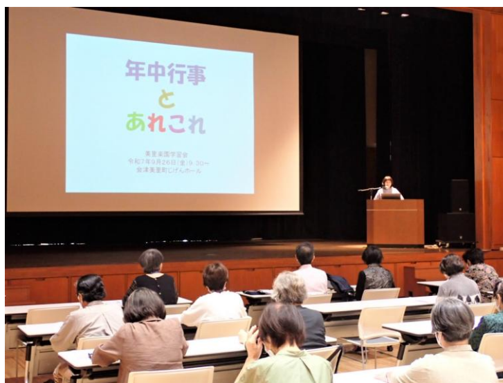
<美里楽園・学習会>