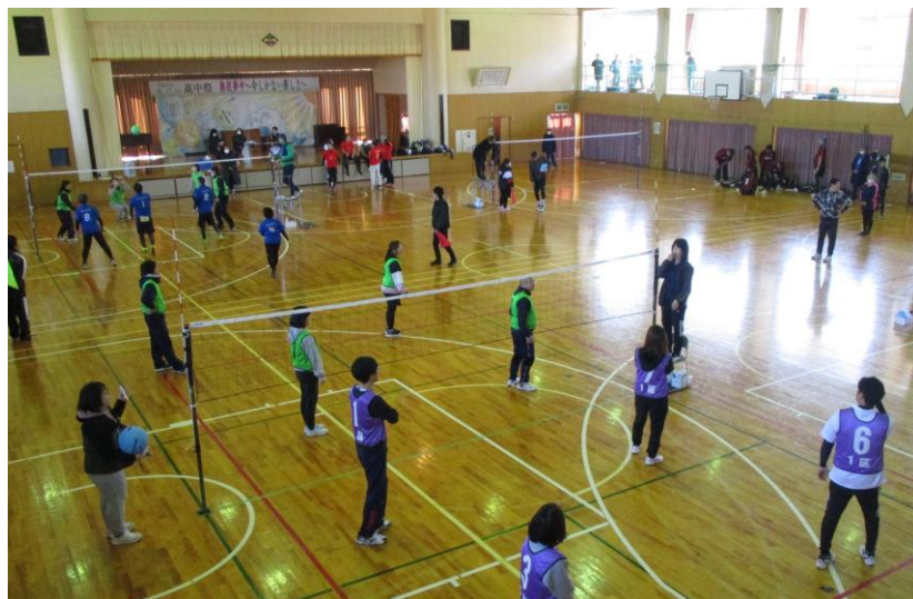
<町民ソフトバレーボール大会>

特に、総合型地域スポーツクラブとの連携を深め、世代間交流を実現するための体制づくりを推進します。