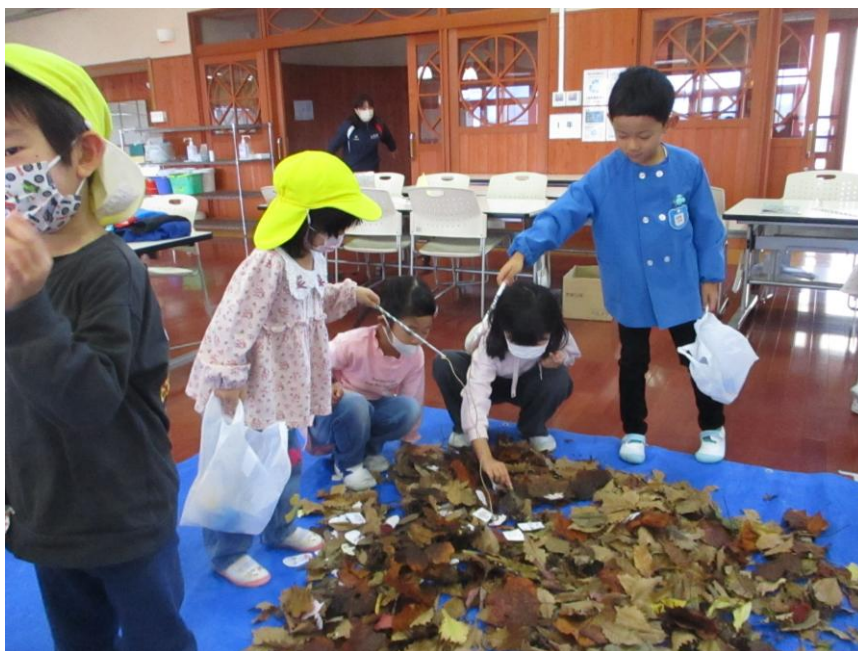
<宮川小学校とこども園きぼうとの交流学習>