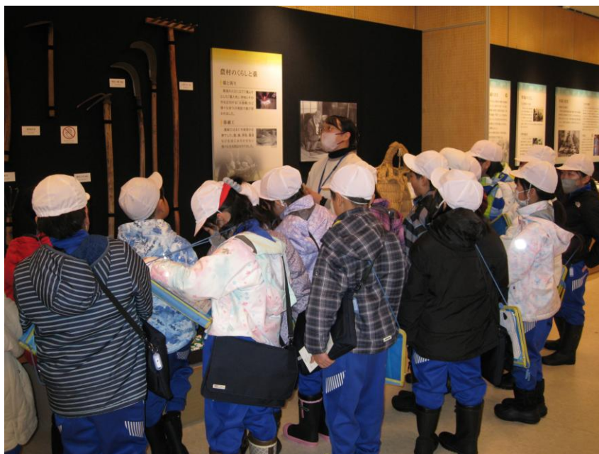
<郷土資料館の見学>