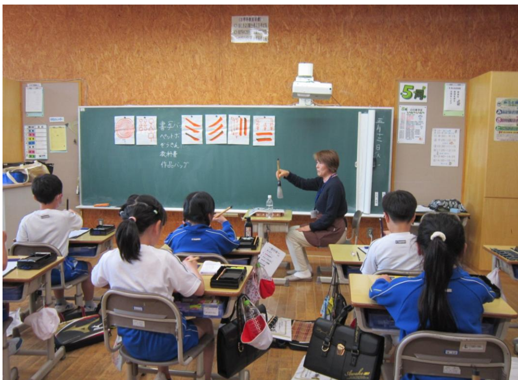
〈学校の応援団の協力による書写の授業〉