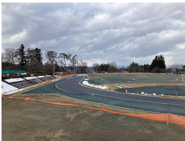
<ふれあいの森公園陸上競技場・改修工事>

策定後5年が経過する本計画の推進状況を評価するとともに、将来のスポーツ施設の在り方を見据えて改善を加え、これに基づいた整備を推進します。