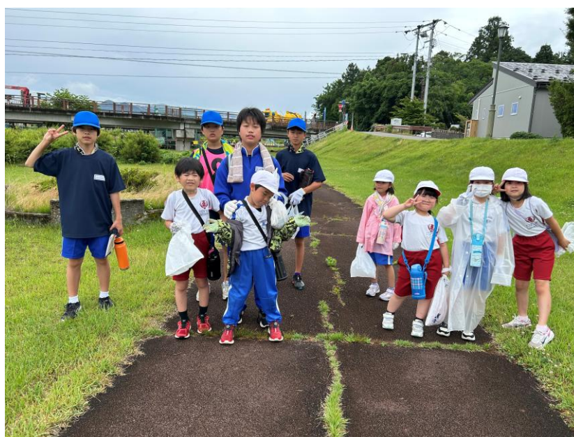
〈高田中学校区三校合同クリーン活動〉

検証にあたっては、「子ども教育の充実」「生涯学習の充実」「生涯スポーツの充実」「地域文化の振興」の4つの教育施策の取組について、指標の達成状況やその実績について、単年度の「点検評価」をもとに、総合的に振り返りました。