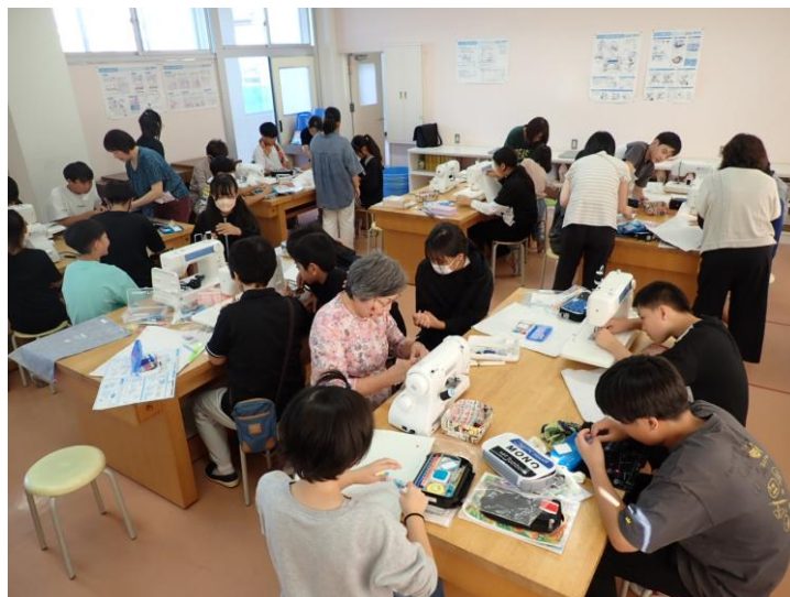
〈学校の応援団・ミシン指導〉

各地域の取組の好事例を共有してプログラムの改善を図るとともに、地域の人材など教育資源を活用した多様な学びや体験を工夫しながら、その充実を図ります。