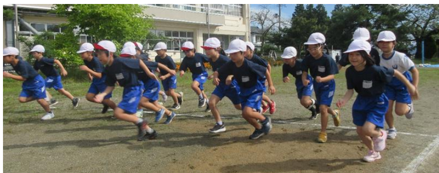
<新鶴小学校の体育の様子>