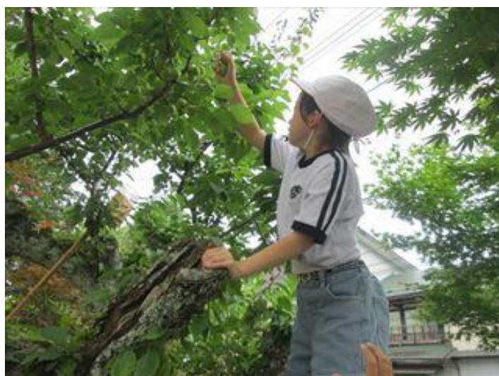
〈総合的な学習の時間における高田梅の収穫〉

働きがいのある学校づくりを支える基盤として、教職員のメンタルヘルス対策を充実させます。そのために、定期的なストレスチェックの実施や専門家によるカウンセリング体制の確保、相談窓口の周知徹底を図り、心身の健康を維持し、安心して働ける環境を整備します。