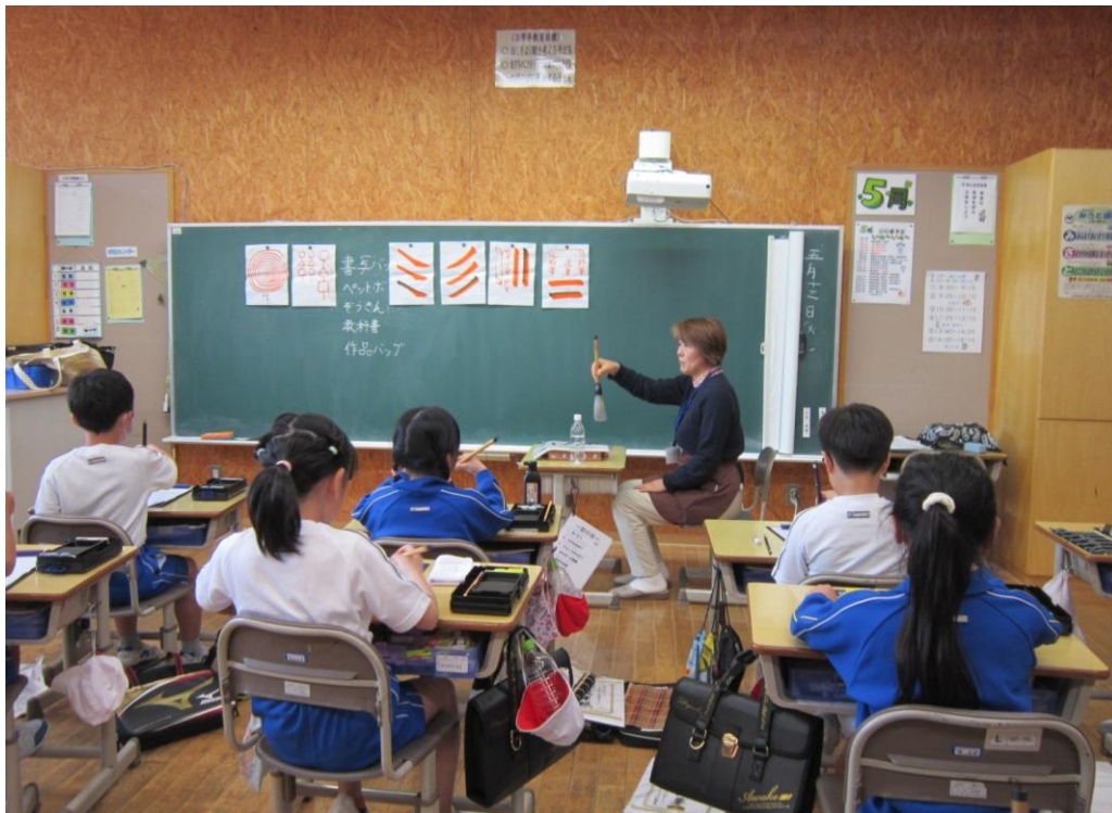
〈学校の応援団の協力による書写の授業〉