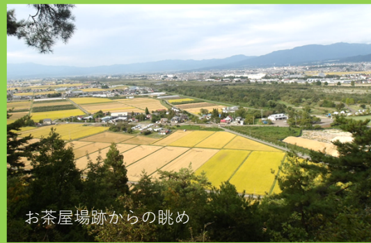
お茶屋場跡からの眺め