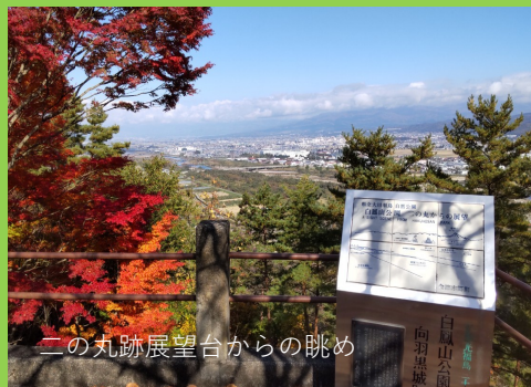
二の丸跡展望台からの眺め