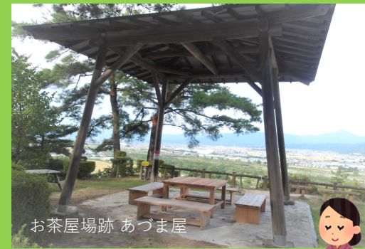
お茶屋場跡 あづま屋