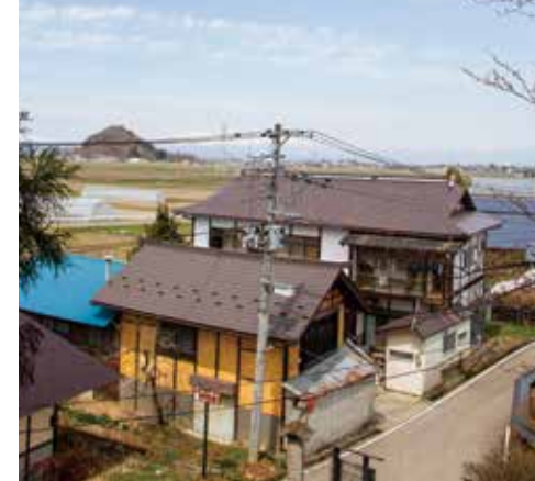
自宅兼作業場、手前が倉庫