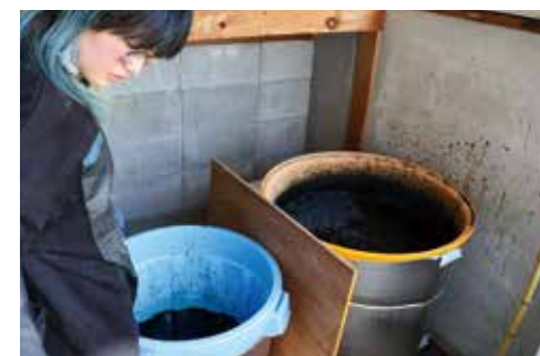
藍を発行させて染料を作っているようす

ていければいいと思います。そういう我々もまだまだ恩返しできていないですが、ちょっとずつ、無理せずやっいてこうと思っています。