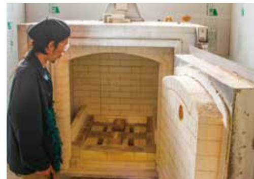
倉庫に入れたガス窯