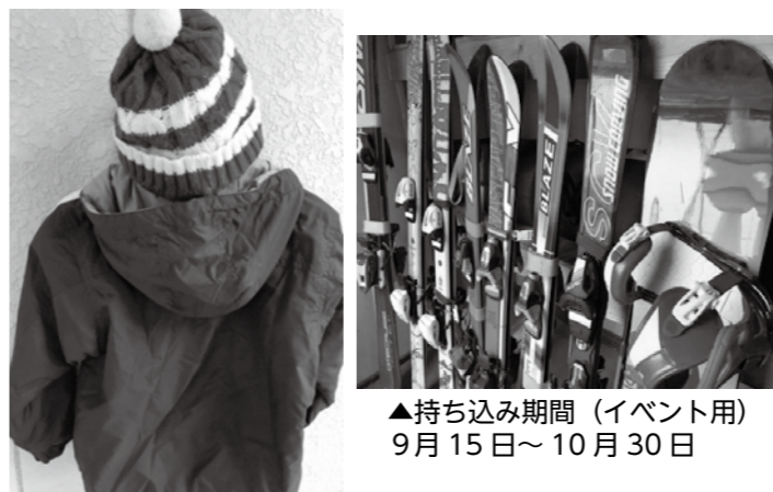
▲持ち込み期間 (イベント用) 9月15日～10月30日