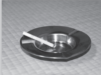
②寝たばこはせず、灰皿には水を入れる