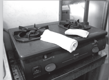
③ガスコンロの周りに物を置かず、そばを離れる時は火を消す