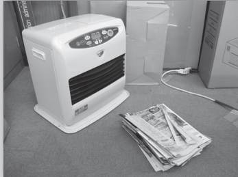
①ストーブの近くには燃えやすい物を置かない

町内において、火災が多発し死亡者が出ています。寒い季節は、暖房器具等の取り扱いが多くなり、乾燥した空気も重なり火災が発生しやすい時期です。暖房器具や火の取り扱いには十分気をつけてください。