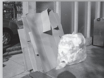
⑤放火防止のために、燃えやすい物を外に放置しない