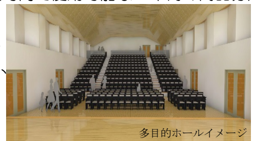
多目的ホールイメージ