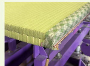
★職人の技で畳縁（たたみへり）を仮止めしたものを機械で縫う