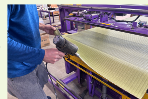
★裁断したところのほつれ止めの処理