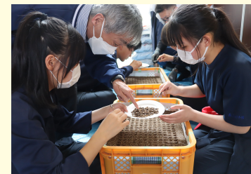
★オタネニンジンの種をコンテナに植える生徒

令和8年3月30日(月)、オタネニンジンの産地再興を目指し、会津農林高校の地域創生科の9名の生徒と、地元企業や農林事務所等と協力しておこなわれました。