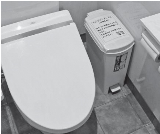
いち早い設置で、安心して利用できますね

町長 安心して公共施設を利用できるように、トイレの種別を問わず、順次すべてのトイレに設置します。