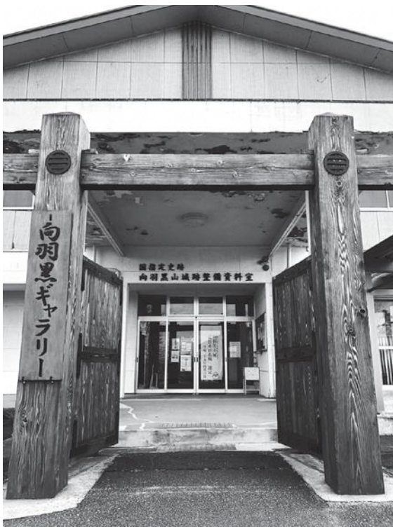
この場所だからこそ、向羽黒山城跡の観光に繋がる。