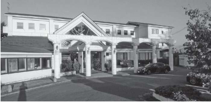
町民の期待。新鶴温泉宿泊施設の再生をしっかりと見守っていかう