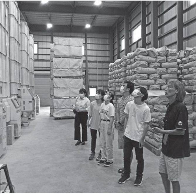
学生と様々な農場を訪れ、現場の声を聞きながら意見交換しました。