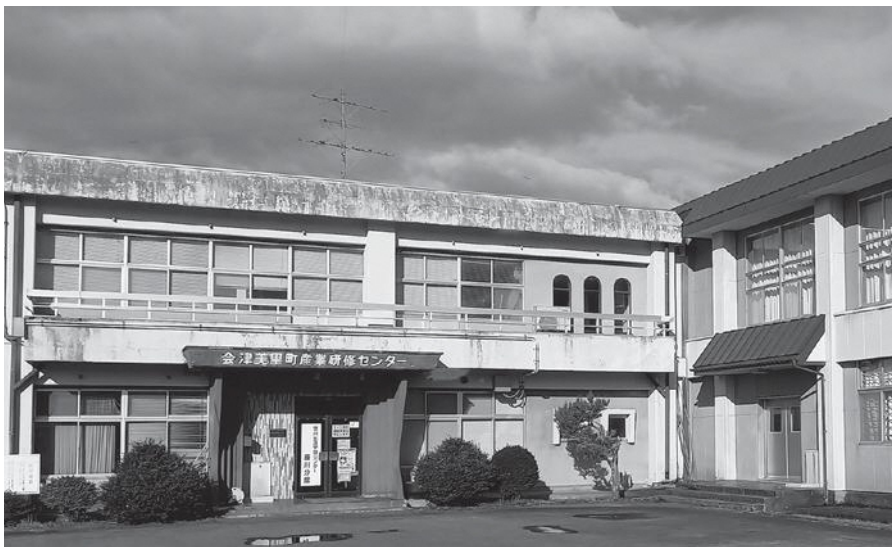
多くの学びと絆を育んだ地域の灯台は姿を消してしまうのか