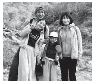
美しの里に住もう! 移住者を増やし持続可能な町の前進と賑わいを!

議員 移住者に対する家賃補助は。 町長 まずは定住を念頭に住宅取得補助を充実させます。