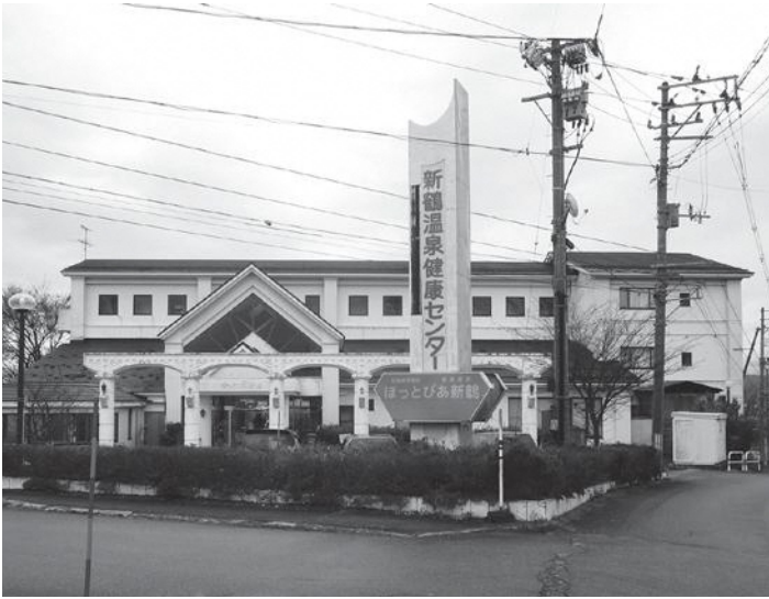
時価1億6,000万円を超える施設が実質わずか21万円で売却