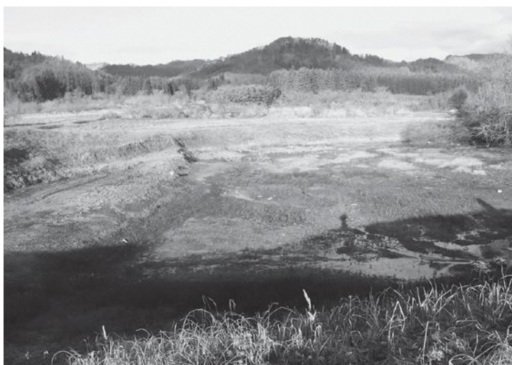
年3回の草刈りで適切に管理されている溜池