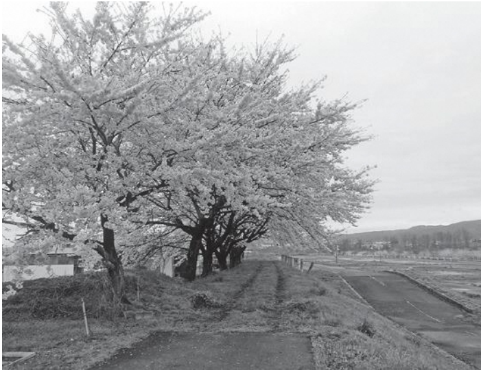
宮川千本桜を後世に残そう。私たちの手で！