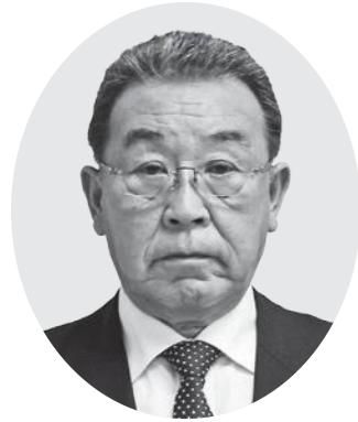
議長 横山 知世志