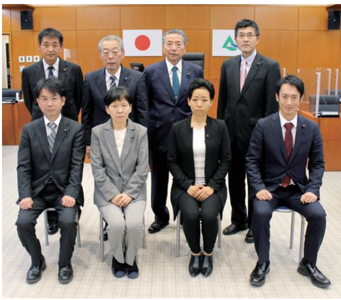
■広報広聴常任委員会